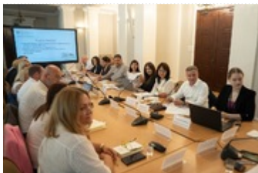
Spotkanie DWRM NIE i Pełnomocników wojewodów ds. mniejszości narodowych i etnicznych 04.09.2024-11