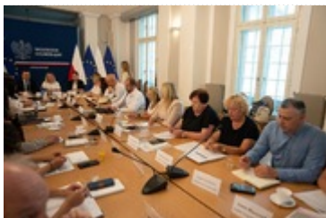
Spotkanie DWRM NIE i Pełnomocników wojewodów ds. mniejszości narodowych i etnicznych 04.09.2024-9