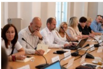
Spotkanie DWRM NIE i Pełnomocników wojewodów ds. mniejszości narodowych i etnicznych 04.09.2024-10