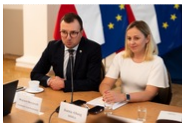
Spotkanie DWRMNIIE i Pełnomocników wojewodów ds. mniejszości narodowych i etnicznych 04.09.2024-2