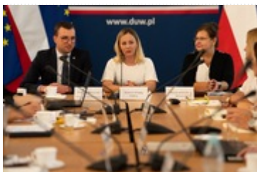
Spotkanie DWRM NIE i Pełnomocników wojewodów ds. mniejszości narodowych i etnicznych 04.09.2024-5