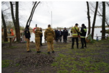
prace w terenie