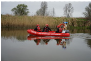
prace w terenie