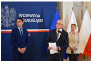
Konferencja prasowa dot. Programu Kolej Plus