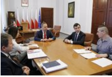
Spotkanie Wojewody Dolnośląskiego z Prezydentem Głogowa