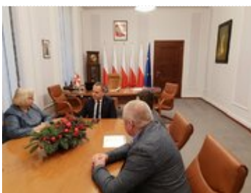
Spotkanie z Komendantem Chorągwi Dolnośląskiej ZHP