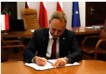
Wojewoda Dolnośląski podczas podpisywania dokumentów