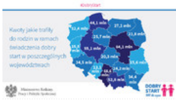
Realizacja programu "Dobry Start" - kwoty jakie trafiły do rodzin