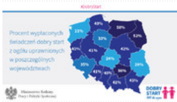
Realizacja programu "Dobry Start" - procent wypłaconych świadczeń