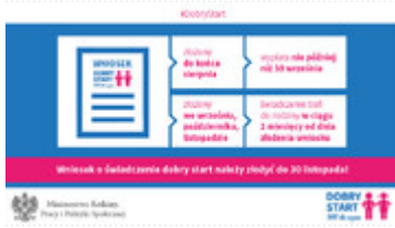
Realizacja programu "Dobry Start"