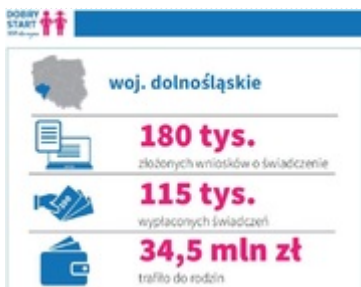
Realizacja programu "Dobry Start"