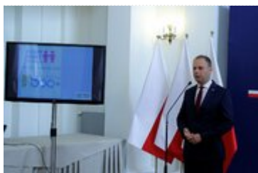
Wojewoda Dolnośląski Paweł Hreniak podczas omawiania programów rządowych Rodzina 500 plus i Dobry Start