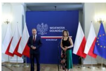
Wojewoda Dolnośląski Paweł Hreniak podczas konferencji prasowej