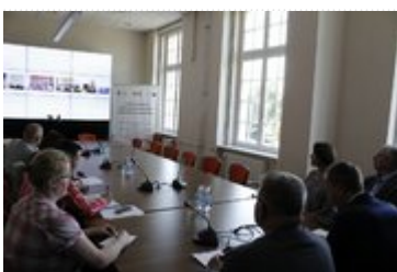
Wideokonferencja z przedstawicielami służb