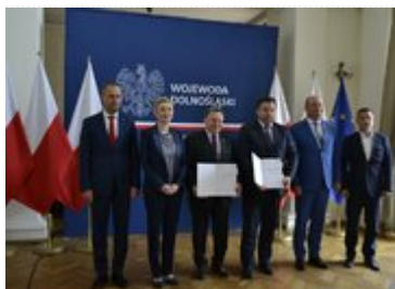
Uroczystość podpisania umowy na dofinansowanie infrastruktury transportowej