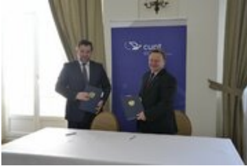
Podpisanie umowy dofinansowania na inwestycje transportowe w województwie dolnośląskim