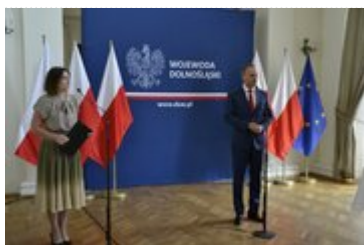
Wystąpienie Wojewody Dolnośląskiego