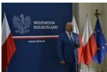
Wystąpienie Ministra Witolda Słowika