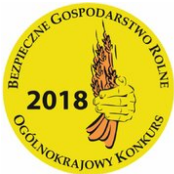
Logo konkursu "Bezpieczne Gospodarstwo Rolne"