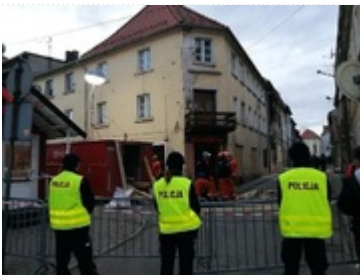
Służby zabezpieczają miejsce zdarzenia w Mirsku