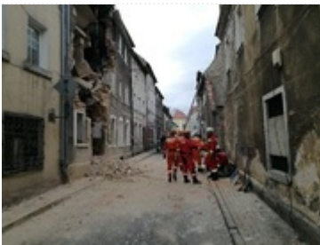
Akcja ratunkowa w Mirsku