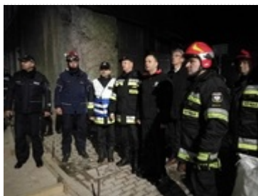
Wojewoda Dolnośląski z Komendantem Wojewódzkim PSP

Wojewoda informuje, że zakończono przeszukiwanie gruzowiska. Służby zabezpieczają miejsce zdarzenia. Na jutro zaplanowano rozbiórkę budynku.