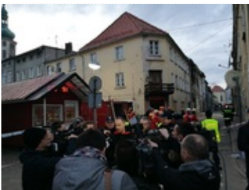
Wojewoda Dolnośląski podczas briefingu prasowego