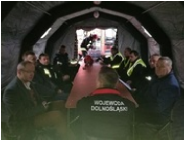
Posiedzenie sztabu kryzysowego na miejscu zdarzenia