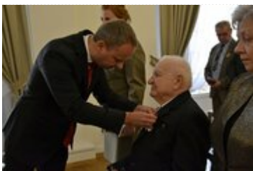
Wojewoda wręcza odznaczenie państwowe

Podczas uroczystości Wojewoda wręczył także Krzyże Zasługi, Medal Pro Patria oraz Medale za Ofiarność i Odwagę, które otrzymali m.in. strażacy z Grupy Ratownictwa Specjalistycznego OSP Starówka.