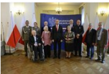
Wspólne zdjęcie Wojewody Dolnośląskiego z odznaczonymi