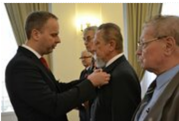
Wojewoda wręcza odznaczenie państwowe