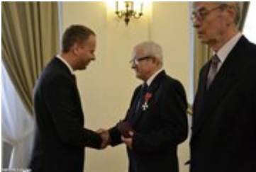
Wojewoda Dolnośląski gratuluje odznaczenia