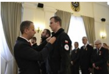
Wojewoda wręcza odznaczenia strażakom