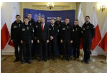
Wojewoda Dolnośląski ze strażakami z Grupy Ratownictwa Specjalistycznego OSP Starówka