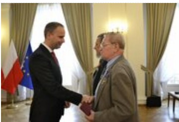
Wojewoda składa gratulacje odznaczonemu