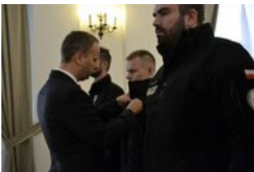
Wojewoda odznacza strażaków Medalami za Ofiarność i Odwagę