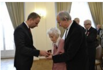
Uroczystość wręczenia odznaczeń państwowych w Dolnośląskim Urzędzie Wojewódzkim