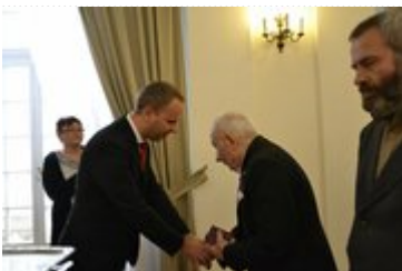
Wojewoda dokonuje aktu dekoracji