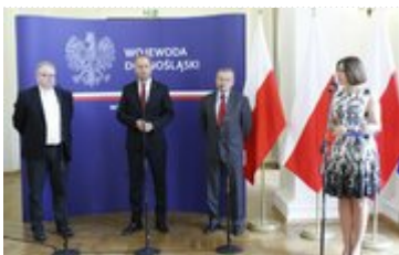
Konferencja prasowa na temat Programu Operacyjnego Pomoc Żywnościowa 2014-2020 na Dolnym Śląsku