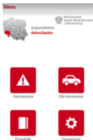
Aplikacja Regionalny System Ostrzegania