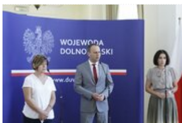
Wojewoda Dolnośląski podczas konferencji prasowej