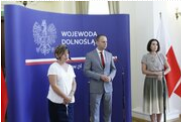
Konferencja prasowa w Dolnośląskim Urzędzie Wojewódzkim