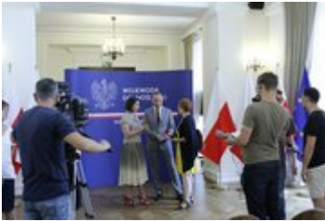
Konferencja prasowa w Dolnośląskim Urzędzie Wojewódzkim