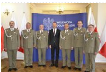
Wojewoda Dolnośląski wraz z odznaczonymi