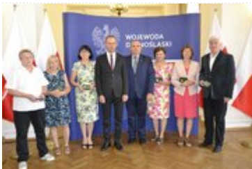
Wojewoda Dolnośląski wraz z odznaczonymi