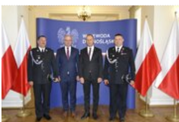
Wojewoda Dolnośląski wraz z odznaczonymi