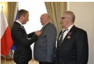
Wojewoda podczas wręczania odznaczeń