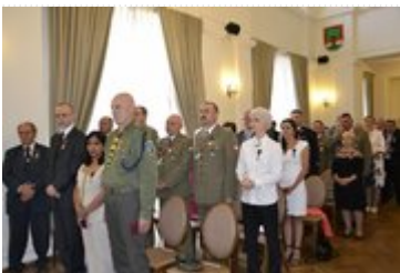
Uroczystość wręczania odznaczeń