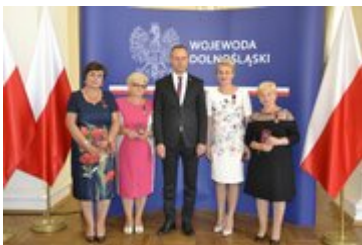
Wojewoda Dolnośląski wraz z odznaczonymi