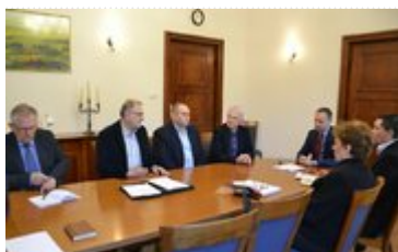
Spotkanie ws. pożaru na terenie składowiska odpadów Mo-Bruk