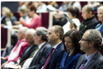
Wojewoda Dolnośląski z uczestnikami konferencji onkologicznej

Spotkanie specjalistów z całego świata Wojewoda Dolnośląski objął swoim patronatem. Lekarze, personel medyczny i naukowcy rozmawiali w budynku Wydziału Farmaceutycznego Uniwersytetu Medycznego we Wrocławiu.