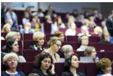
Uczestnicy konferencji onkologicznej we Wrocławiu