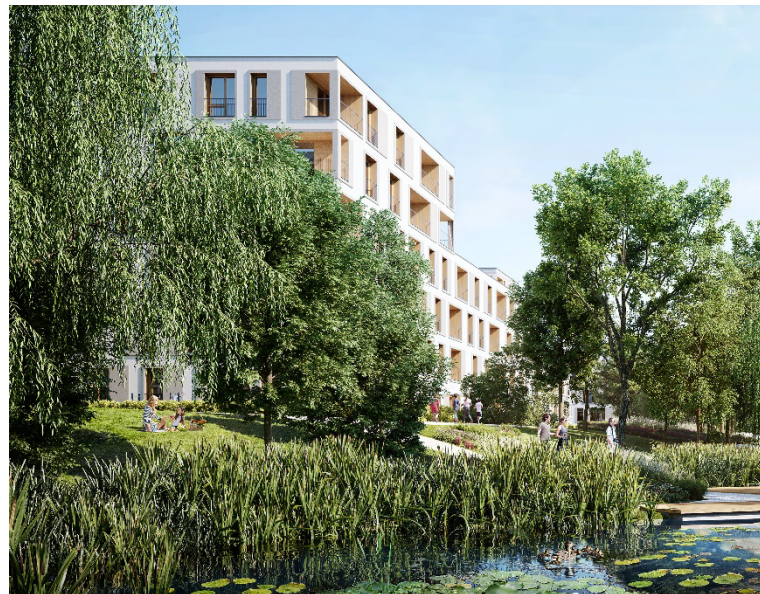
Warszawa Ursynów Płd. 2,7 tys. mieszkań