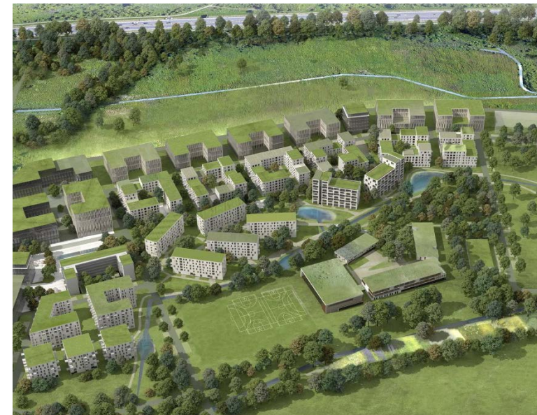
Kraków Kliny 1,1 tys. mieszkań