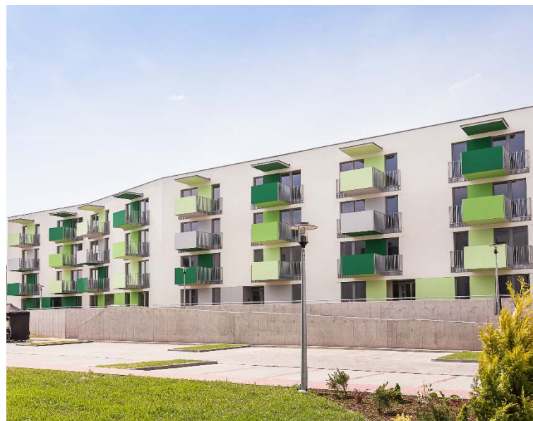
Biała Podlaska 186 mieszkań