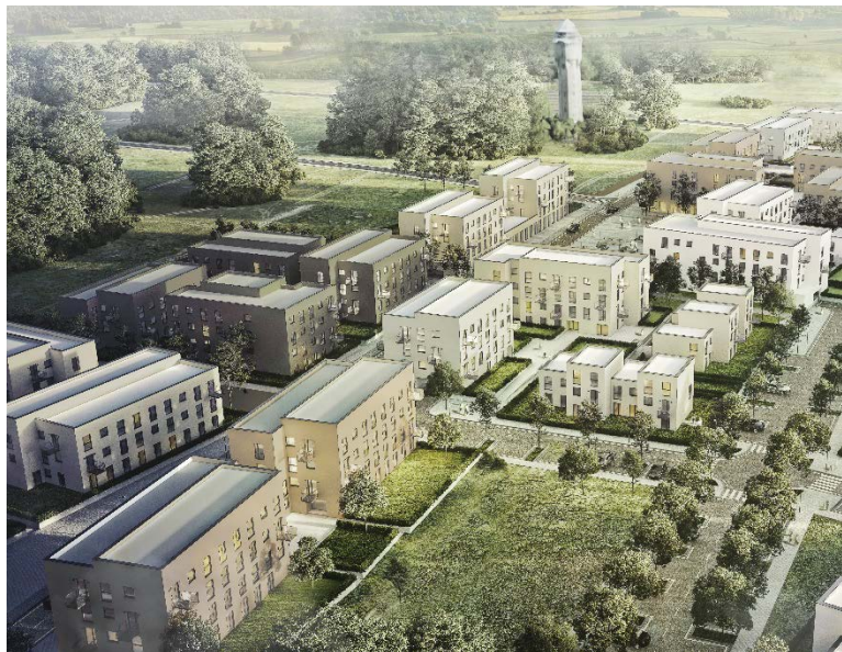
Katowice Giszowiec 550 mieszkań