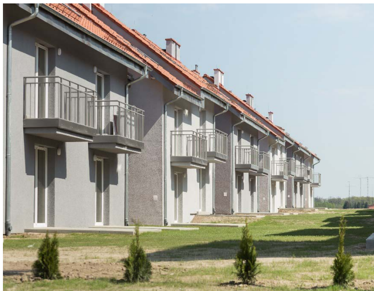
Jarocin 258 mieszkań