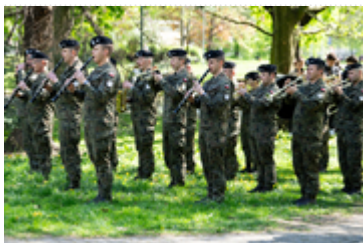
Dzień Pamięci Ofiar Zbrodni Katyńskiej2024 (17)