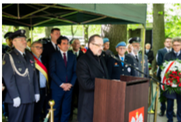
Dzień Pamięci Ofiar Zbrodni Katyńskiej2024 (18)