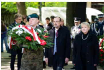
Dzień Pamięci Ofiar Zbrodni Katyńskiej2024 (16)