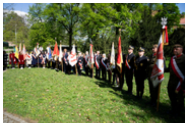
Dzień Pamięci Ofiar Zbrodni Katyńskiej2024 (20)