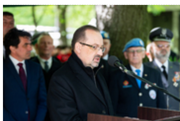
Dzień Pamięci Ofiar Zbrodni Katyńskiej2024 (13)