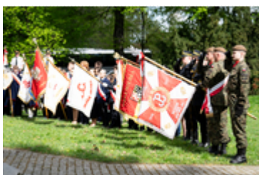
Dzień Pamięci Ofiar Zbrodni Katyńskiej2024 (8)