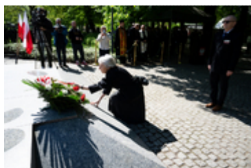
Dzień Pamięci Ofiar Zbrodni Katyńskiej2024 (21)