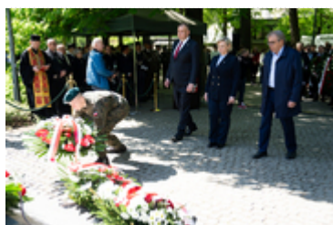
Dzień Pamięci Ofiar Zbrodni