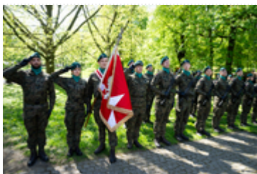
Dzień Pamięci Ofiar Zbrodni Katyńskiej2024 (19)