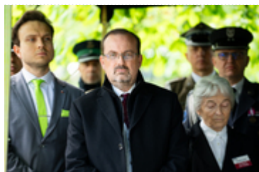
Dzień Pamięci Ofiar Zbrodni Katyńskiej2024 (12)