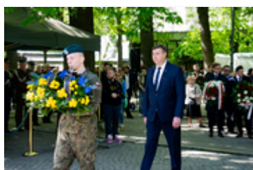
Dzień Pamięci Ofiar Zbrodni Katyńskiej2024 (24)