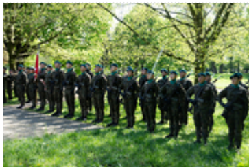
Dzień Pamięci Ofiar Zbrodni Katyńskiej2024 (3)