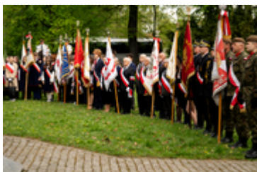
Dzień Pamięci Ofiar Zbrodni Katyńskiej2024 (7)