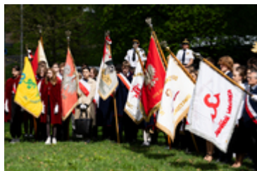
Dzień Pamięci Ofiar Zbrodni Katyńskiej2024 (9)