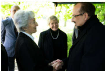
Dzień Pamięci Ofiar Zbrodni Katyńskiej2024 (4)