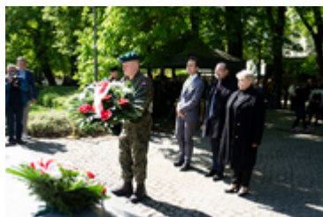
Dzień Pamięci Ofiar Zbrodni Katyńskiej2024 (23)