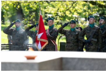
Dzień Pamięci Ofiar Zbrodni Katyńskiej2024 (15)