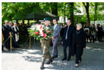
Dzień Pamięci Ofiar Zbrodni Katyńskiej2024 (22)