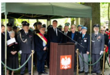
Dzień Pamięci Ofiar Zbrodni Katyńskiej2024 (6)